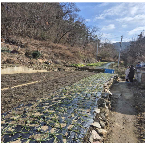
마을공동텃밭공원 조성 부지