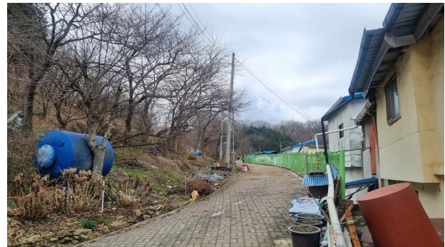
조망길 현재 모습