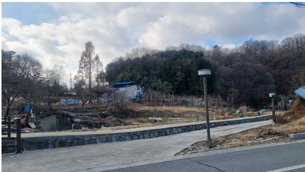
주민공동복합이용시설이 들어설 부지